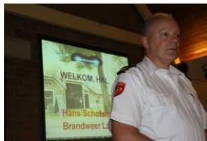
Vrijwilligers-doe-schoonmaakdag: buiten- en binnengebeuren.