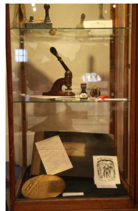
De nieuwe aanwinsten-vitrine

Er werd een beperkt aantal zaken in bruikleen gegeven aan de Historische Kring Laren. Het beleid van de Historische Kring is, bruiklenen zoveel mogelijk te beperken. Dit in verband met verzekering, verantwoording en toekomstig gebruik.