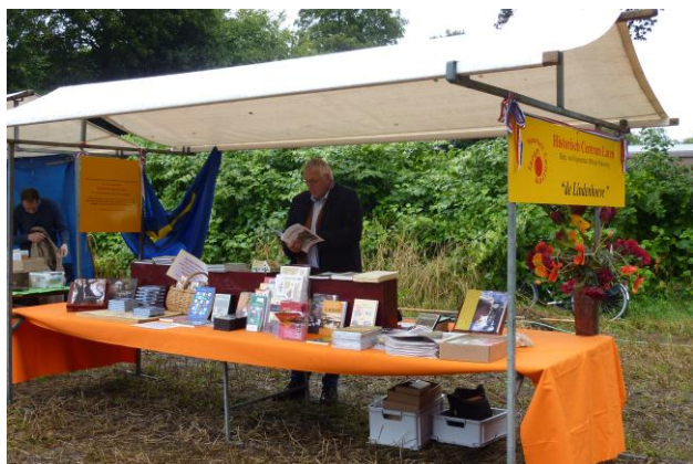
Kraam Historische Kring tijdens het Soll-oogstfeest

Onze Historische Kring bemande een kraam op de braderie op Koninginnedag, op het oogstfeest van de Stichting Oude Landbouwgewassen en op de INmarkt Laren. Er was grote belangstelling. Dat leverde ook nieuwe donateurs op. Onze aanwezigheid op deze dagen droeg ook bij aan de verkoop van historische boeken en documenten. Deze aanwezigheid past in ons streven om (meer) zichtbaar te zijn in de Larense gemeenschap en daardoor de historie de aandacht te geven die het toekomst!